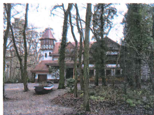
zurück über die Insel Rott